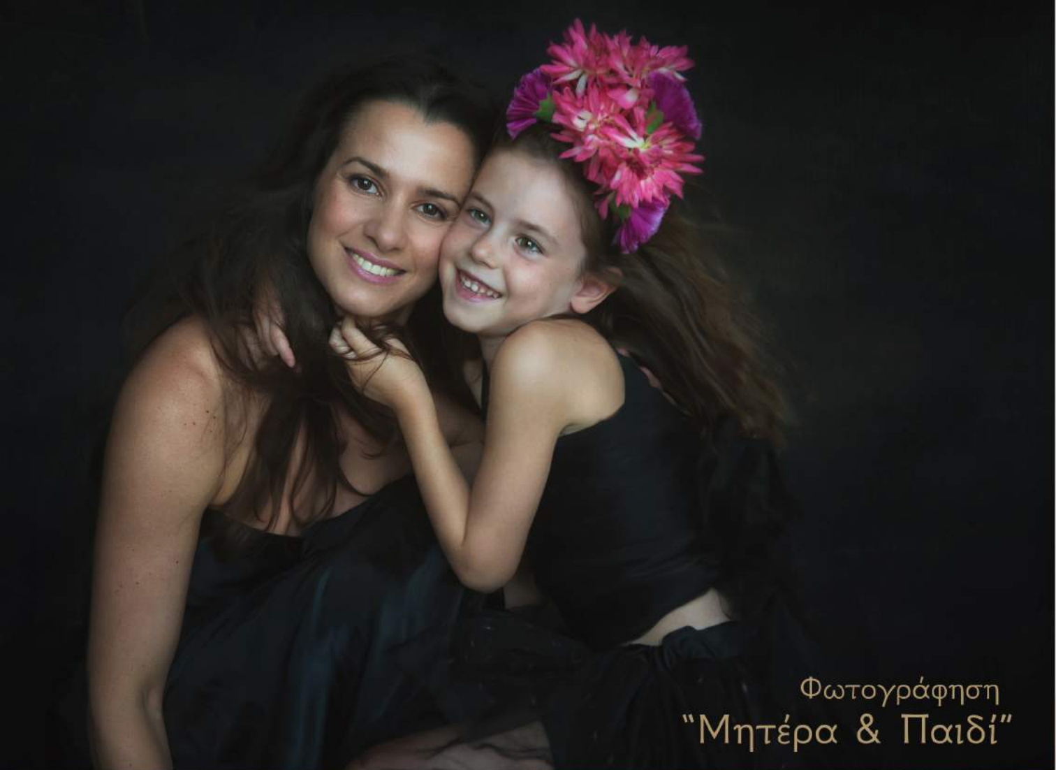
Φωτογράφιση "Μητέρα & Παιδί"